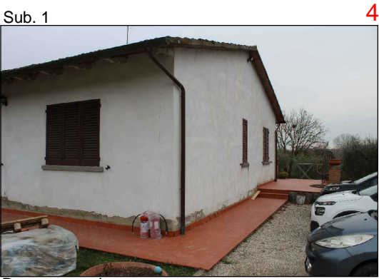
Prospetto sud-est. Si notano le importanti lesioni presenti alla base del fabbricato.