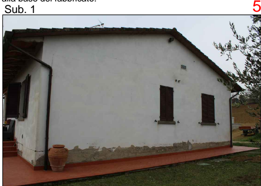
Prospetto nord. Si notano le importanti lesioni presenti alla base e nei prospetti del fabbricato.