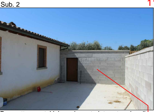
Prospetto ovest. Volume in parte interrato privo di autorizzazioni