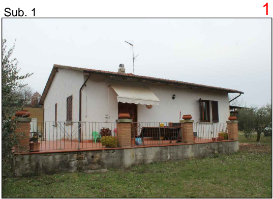
Veduta dalla strada di accesso