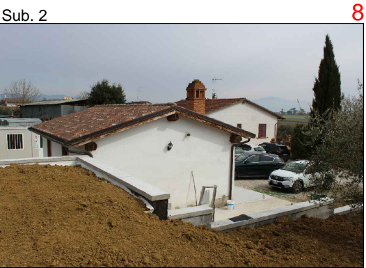
Prospetto sud. Veduta generale si nota anche il Sub. 1