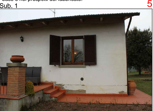
Prospetto est. Si notano le importanti lesioni presenti alla base e nei prospetti del fabbricato.